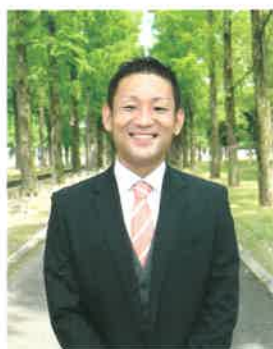
入居相談員/代表取締役