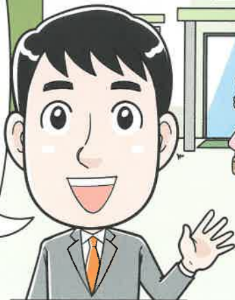
結ほ〜む 入居相談員

「結ほ〜む」は、 大阪府内にある全施設の中から 予算・身体状況・地域など ご希望に合った施設を 無料でお探しします！